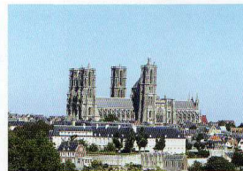
Escalier de Saint-Martin